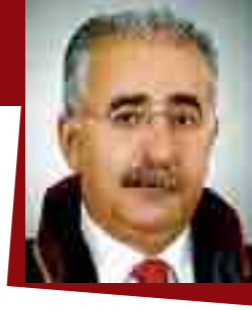
Av. Hayrettin KENT

Sizlere Elazığlı bir yazar ile bu yazarın “Yığıkili Zülküf” isimli romanını tanıtmak istiyorum.