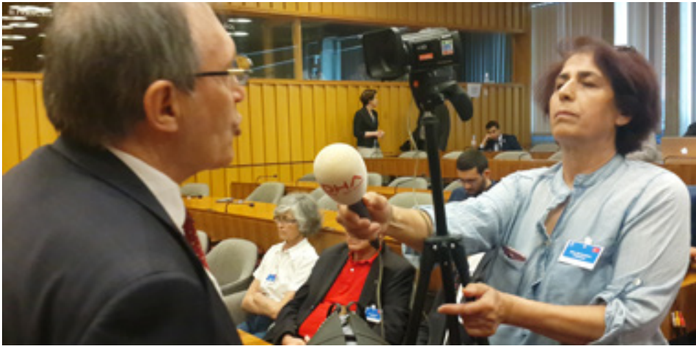
AGENCE DOĞAN HABER / DOĞAN HABER AJANSI (DHA)