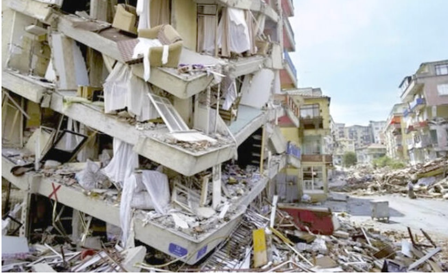
Resim 1. Elazığ-Sivrice depreminde, depreme dayanıklı bina standardına uymadığı için yıkılan ve zarar gören binalar.

İlde 35 okul hasar görmüş olup, bunlardan ağır hasarlı olan 10' u yıkılmıştır. Yıkılan bu okulların yerine yenilerinin yapımı için start verilmiştir.