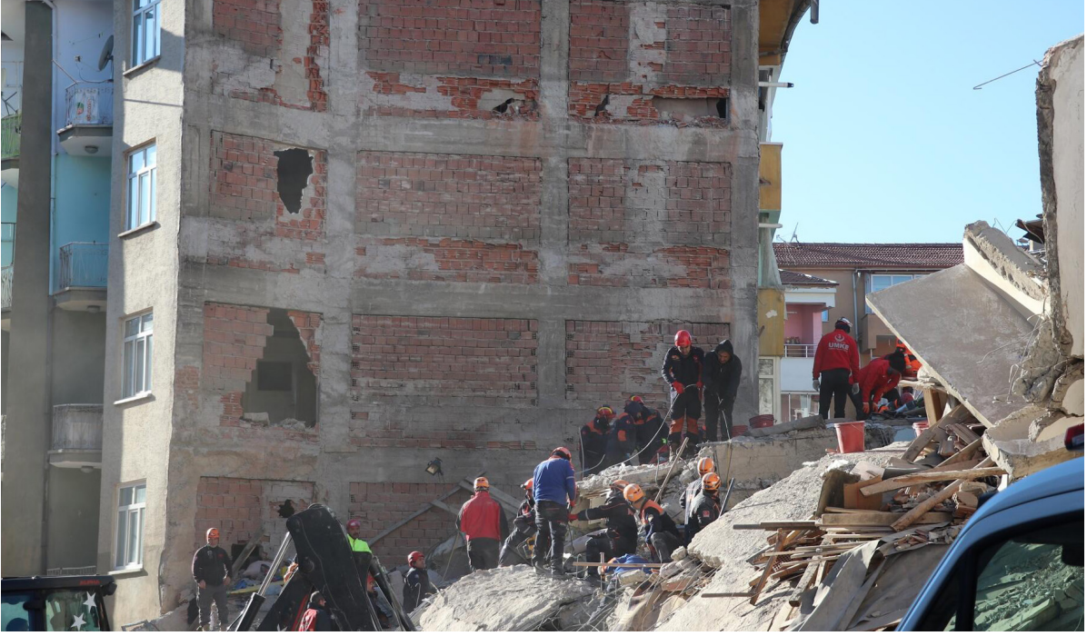
Resim 2. 20 Ocak 2020 Elazığ depreminde yıkılan bir binada kurtarma çalışmaları.

3.1.a. Elazığ ve deprem olması hala muhtemel olan çevre coğrafyasındaki tüm bina stoğunun ivedilikle gözden geçirilerek, envanteri çıkarılmalı ve az hasar gören bina stoğu acilen depreme dayanıklı hale getirilmelidir.