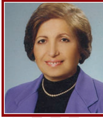
Sevim (Anagür) KOYUNOĞLU

İlginç bir başarı öyküsünden söz etmek istiyorum. Öykünün kahramanı, kökleri Elazığ'a uzanan genç bir mimar, Özgül Öztürk.