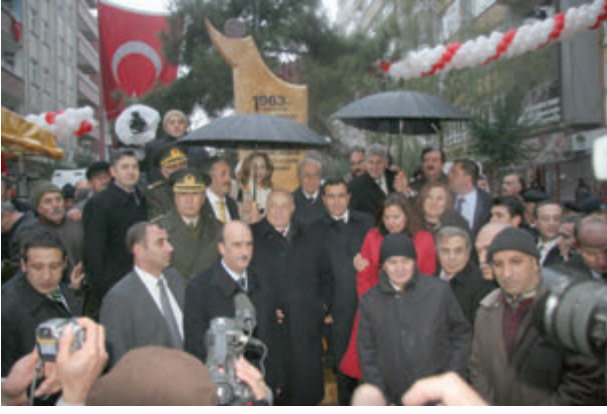
Anıtın Açılışına Katılanlar