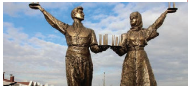
Ankara Dikmen Çankaya Belediyesi Çaydaçıra Parkı