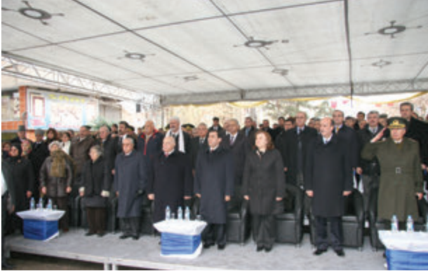
Açılış Töreninin Başlangıcında İstiklal Marşımız