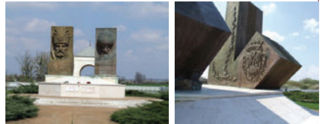
Szeged'deki (Macaristan) Kanuni Sultan Süleyman büstü