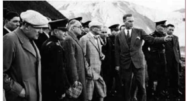
Atatürk'ün 15 Kasım 1937 tarihinde Cumhurbaşkanı olarak Maden'e ziyareti